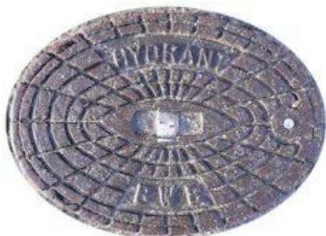
Abbildung 2: Abdeckung Unterflurhydrant